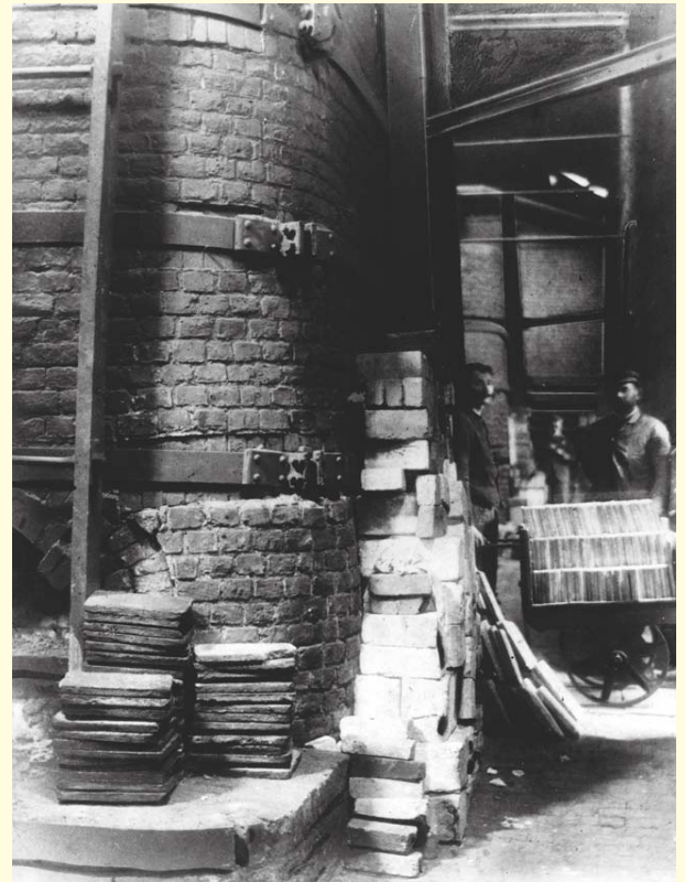
Фабрика Winckelmans 1894 г.